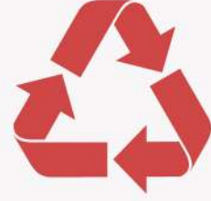
Temiz Sarf Malzemeleri