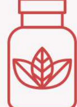
Taze Sebze - Meyve